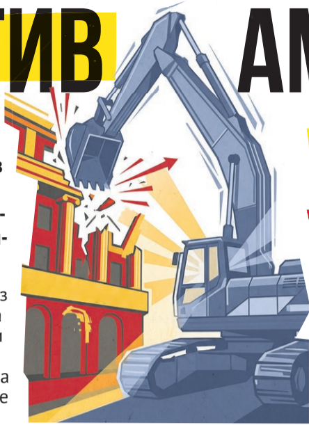
Иллюстрация: Алексей Беленёв