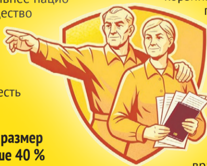
Иллюстрация: Алексей Беленев

В общем, доверять ли государству, решать по-прежнему каждый сам за себя. Но, выбирая конкретный пенсионный фонд, лучше, конечно, семь раз проверить и лишь потом один – доверить.