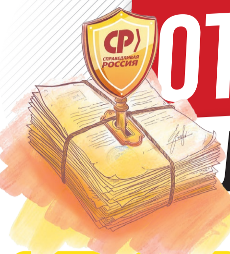
Иллюстрация: Надежда Карева

Есть политика больших цифр — миллиарды, стройки, отчеты. А есть другая политика: