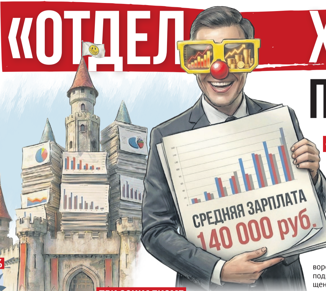
Иллюстрация: Алексей Беленев