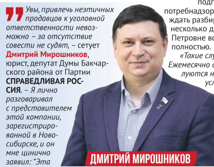
ДМИТРИЙ МИРОШНИКОВ

7,8 МЛН прочие вопросы (споры с госорганами, незаконные списания денежных средств приставами, защита прав потребителей, благоустройство территорий).